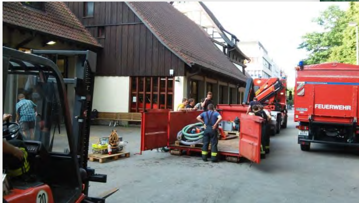
Verlastungsmaßnahmen für LK BC in BaWu und RV (hier RV)