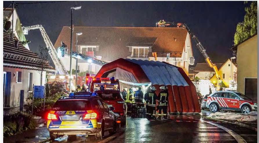
Massive Gebäudeschäden nach Tornado in Bad Waldsee (Reute)

Einmal mehr hat sich gezeigt, wie wichtig unsere Fachberater Meteorologie sind. Sie haben uns die „nassen Tage“ nahezu rund um die Uhr mit Prognosen und Fakten versorgt. Herzlichen Dank für diese hervorragende Arbeit!