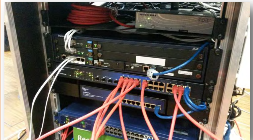
Das Herzstück der Telefonanlage: der Einschub in die bereits vorhandenen 19"-Gehäuse der FÜS-EDV