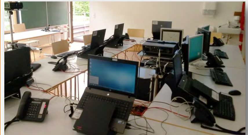
Führungsstab Allgäu im aufgebauten Zustand. Die Verlastung erfolgt in Flight-Cases, der Transport mittels GW-T oder AB-Führung