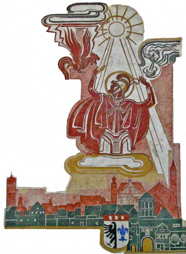
Bild: Hl. Florian über der Stadt Wangen, Toni Schönecker 1956, Altes GH Wangen im Allgäu (S. Wiltsche)

Fazit: Sachlich richtig bezeichnet müsste es beispielsweise heißen: „Wir laden Euch herzlich ein zur Fahrzeugsegnung unseres neuen LF10/6 “ oder: „Zur Einsegnung des neuen Feuerwehrgerätehauses in Musterstadt erschienen zahlreiche Mitfeiernde sowie Kameradinnen und Kameraden aus dem weiten Umland.“.