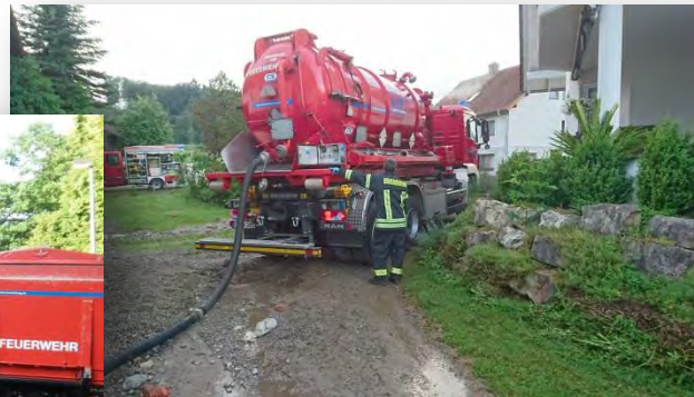
Einsatz AB-Saug im LK BC