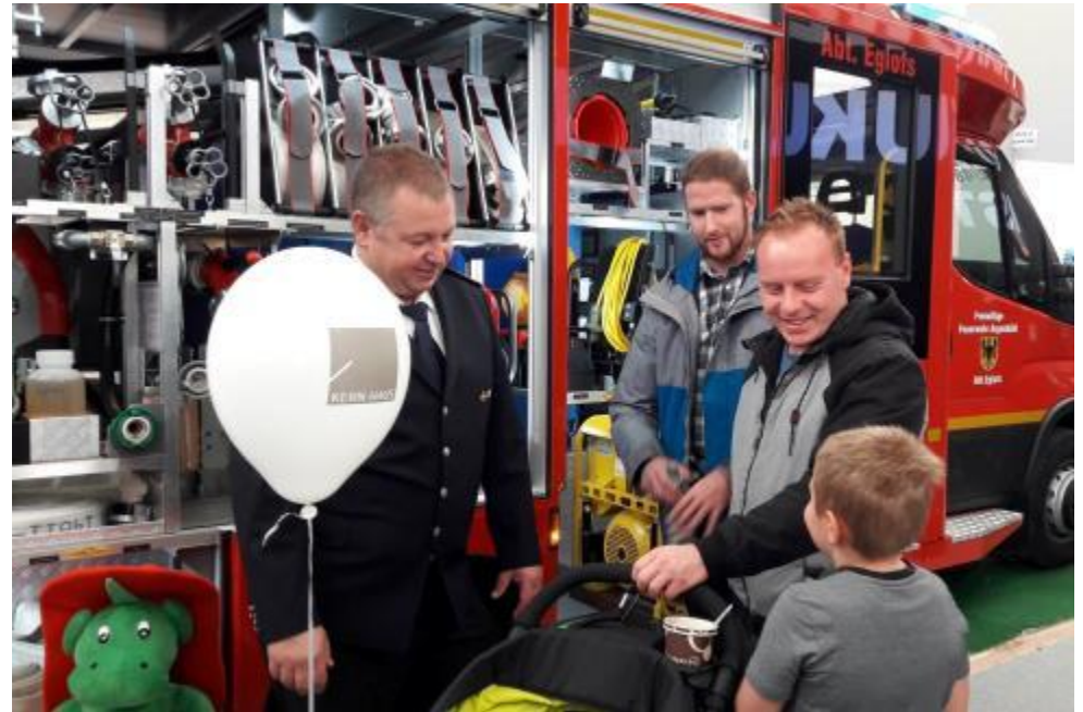
Bild KfV: Rd. 2.000 Gäste besuchten im Jahr 2017 den Stand der Feuerwehren des Landkreises in der Messehalle 2. Herzlichen Dank an alle, die uns letztes Jahr unterstützten und auf ein Neues vom 13. – 21. Oktober, wieder in der Halle 2 der Oberschwabenschau in unserer Kreisstadt.

Wir werden fortlaufend über die Entwicklungen berichten. Bezüglich Personalkonzept wird der KBM in den nächsten Wochen auf die Feuerwehren zugehen. Wir freuen uns bereits heute auf eine breite Unterstützung der Feuerwehren, spannende Gespräche, eine moderne Öffentlichkeitsarbeit und eine nachhaltige Werbung für unsere großartige Sache.