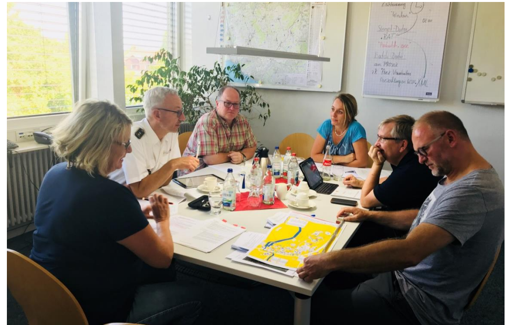
Arbeitsgruppe „Feuerwehrpläne“ im Besprechungsraum der Landkreisverwaltung unter Beteiligung von Fachplanern sowie des Kreisbrandmeisters des Landkreises Sigmaringen

Sämtliche Richtlinien und Hinweise des Landkreises Ravensburg zum Vorbeugenden Brandschutz stehen hier zum Download bereit.