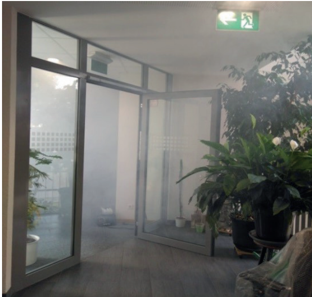
Abbildung 1: Verrauchter Treppenraum mit unterkeilter Brandschutztüre