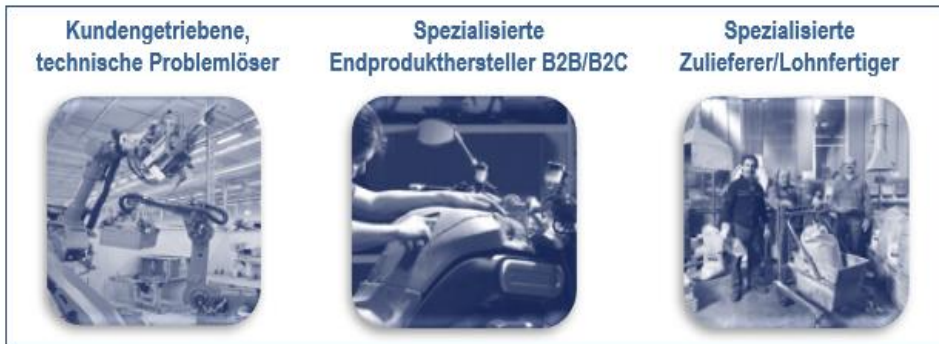
Abbildung 1 Zielkunden