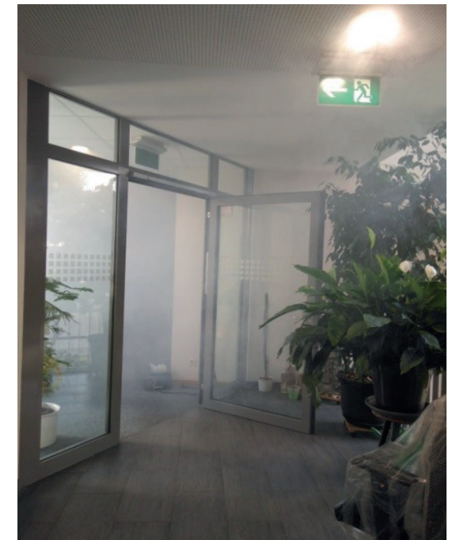
Abbildung 2: Verrauchter Treppenraum mit unterkeilter Brandschutztüre